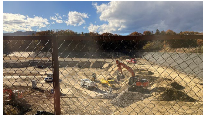
13号埋立地（即日覆土の様子）

埋立対象は焼却灰や不燃破砕物であり、環境整備センターでは産業廃棄物処理業者からの受け入れを拡大しようとしています。