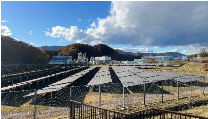
メガソーラーと循環工場（奥）

11月30日（木）、事務局で埼玉県環境整備センターを見学しました。埼玉県環境整備センターは、全国でも珍しい県直営の管理型最終処分場で、埋立容量は184万 \text{m}^3 です。県内市町村等からの一般廃棄物や、県内中小企業等からの産業廃棄物を受け入れています。埋立跡地には公園やメガソーラーが整備され、さらに敷地内に彩の国資源循環工場が立地しています。