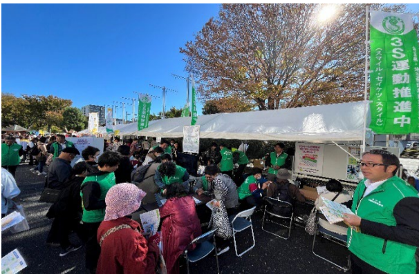
ブース風景（大勢の皆様にお越しいただき大盛況）

(株) ショーモン3名、ウム・ヴェルト (株) 4名、(株) タカヤマ5名、(株) シタラ興産4名、クリーンシステム (株) 2名、(株) ケイ・エム環境2名、(株) クリーンテックサーマル2名、(株) 環境サービス、石坂産業 (株)、都築鋼産 (株)、(株) 三栄興業、(株) タイセイリサイクル、(株) スリーエイセズ、(株) イタバシ 以上14社 28名