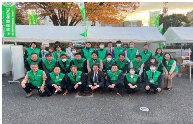
運営スタッフ集合写真