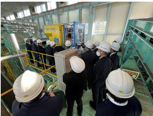
廃プラ類の高度選別施設

視察当日は天候にも恵まれ、新雪を被った立山連峰を間近に望めるロケーションの中、すべての施設を確認することができました。特に、廃プラスチック類の高度選別施設については、施設内部に入り、各種設備を詳細に見学することができ、大変参考になりました。（調査研修事業委員会：石坂典子委員長）