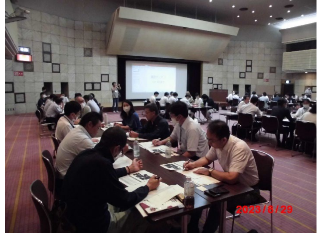
ワークショップ（浦和会場）