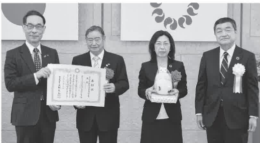
県民部門大賞受賞