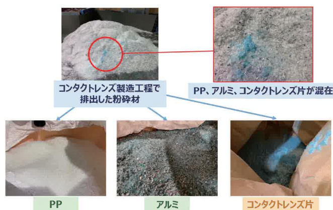
カーボンニュートラルと向き合う サーキュラーエコノミーシステムの導入