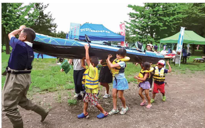
入間川の水辺周辺整備と自然を守る環境学習