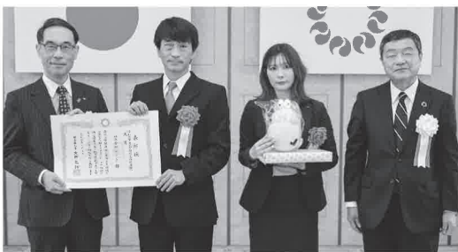
事業者部門大賞受賞