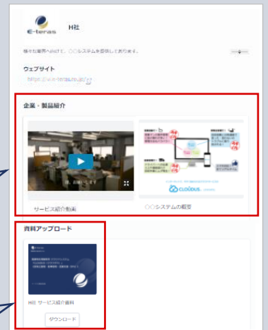
▲ 企業ブースのイメージ