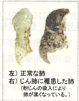
左) 正常な肺 右) じん肺に罹患した肺 (粉じんの吸入により肺が黒くなっている。)

現在、じん肺を治す根本的な治療がないため、じん肺にかからないための措置として、粉じんの発生源対策、局所排気装置等の適正な稼働、呼吸用保護具の適正な着用などにより、粉じんへの「ばく露防止対策」を徹底することが重要です。