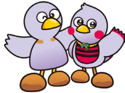
埼玉県マスコット 「コバトン・さいたまっち」